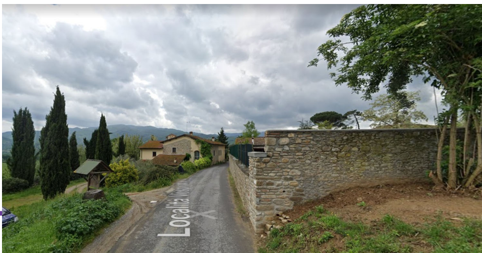
La frazione di Pesciola di Vicchio nel Mugello, da Google maps.

di Pesce, Iacopo di Paradiso († 1323), Adimari († 1321) e Forte (tutti con 10 soldi ciascuno).